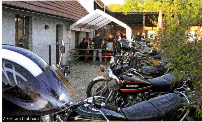
Z-Fest am Clubhaus